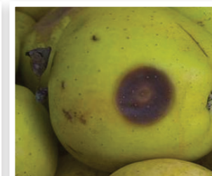
Neofabraea (=Gloeosporium) op appel