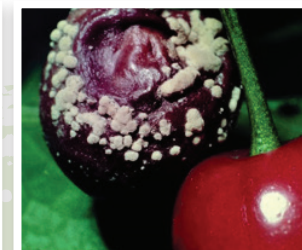
Vruchtrot door monilia