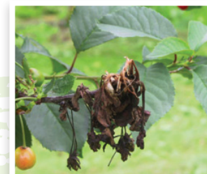
Bloesemsterfte in kersen

In kersen is een toepassing rond de bloei effectief tegen Monilia spp. (tak- en bloesemsterfte) en 2 weken voor de pluk tegen vruchtrotsorten ( Monilia spp. , Botrytis).