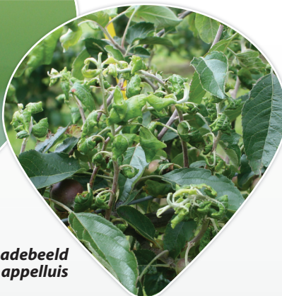
Schadebeeld Roze appelluis