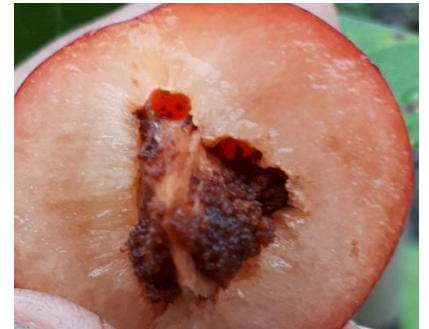
De eerste generatie pruimenmot is signaleerd.

Coragen® veroorzaakt, direct na opname, verlamming van het spierstelsel van o.a. etende insecten zoals de larven van de pruimenmot. Door de snelle werking stopt direct na opname de vruchtschade. Coragen® is binnen twee uur regenvast. Temperatuur en UV-straling hebben nauwelijks invloed op de werking van Coragen®. Door het wegvallen van Insegar is Coragen® door zijn sterke en lange werkingsduur het juiste alternatief op de 1 e generatie pruimenmot in te zetten. Nadat de eerste eiafzet plaats gevonden heeft maar voordat de eieren uitkomen, is het verstandig om de eerste behandeling met Coragen® uit te voeren. Herhaal de behandeling na 3 weken.